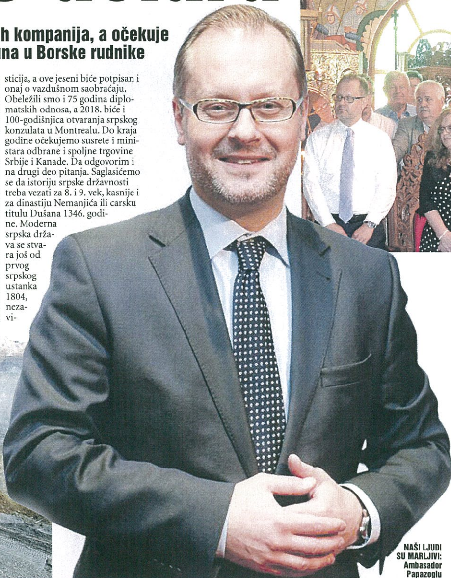
NAŠI LJUDI SU MARLJIVI: Ambasador Papazoglu