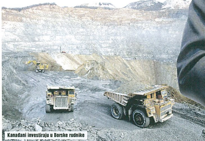
Kanadani investiraju u Borske rudnike